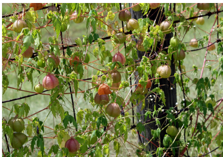
Ballonrebe - Cardiospermum halicacabum

Zur Behandlung von Hautekzemen kommt der Extrakt der Ballonrebe in einer Salbengrundlage zum Einsatz.